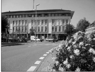
Die Praxis befindet sich im Geschäftshaus Vindonissa, 3. Stock